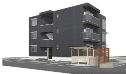
完成予想図につき実際とは多少異なる場合があります