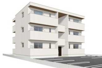
完成予想図につき実際とは多少異なる場合があります